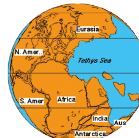
Pangea 245 m.y.

fiori (355 mln di anni fa). Alcune specie di pesci riescono ad adattarsi alla vita sulla terraferma, compaiono gli anfibi; sono i primi vertebrati terrestri. La Terra si ricopre di grandi foreste, alcune specie di insetti, che erano già molto diffusi, sviluppano le ali e la capacità di volare, per la prima volta un essere vivente spicca il volo. Nascono i rettili, sono i primi vertebrati completamente adattati alla vita sulla terraferma; non hanno bisogno di ritornare in acqua per riprodursi (come succede per gli anfibi) grazie ad una "rivoluzionaria" innovazione: l'uovo amniotico. I rettili iniziano a colonizzare anche le zone più aride e asciutte dei continenti che finora non avevano visto la presenza di alcun vertebrato. Alla fine del Permiano gli attuali continenti sono tutti riuniti in un unico "supercontinente": la Pangea. Il clima piuttosto freddo di molte parti delle terre emerse favorisce la comparsa di un particolare tipo di rettili, i Terapsidi, con caratteristiche simili a quelle che avranno in seguito i mammiferi (omeotermi). Si riporta appresso l'immagine della terra (Pangea), per come si trovava 250 mln di anni fa.